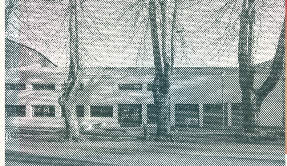
Escuela de Arquitectura Universidad del Bío-Bío / Concepción

Grado de Licenciado/a o Título profesional universitario legalizado ante notario de Instituciones reconocidas por el Ministerio de Educación o extranjeras, con un plan de estudio de a lo menos ocho semestres. En caso de certificaciones académicas extendidas en el extranjero, éstas deberán acreditarse mediante instrumentos apostillados o legalizados en Chile.