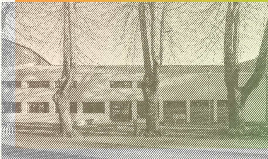
Escuela de Arquitectura, Universidad del Bío-Bío / Concepción

Licenciados/as en arquitectura o arquitectos/as (o denominaciones similares según evaluación del Comité Académico), motivados por el desarrollo de proyectos arquitectónicos en el ámbito latinoamericano.